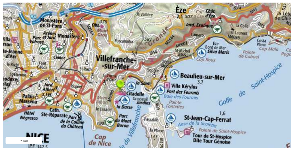
Périmètre du SIS Cartes IGN - IGN